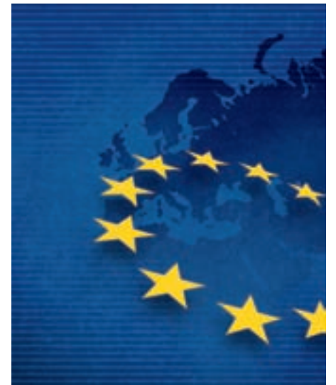
Den nye Kommissjonen vil på nyåret legge frem sin visjon om EU 2020. Det vil utløse en ny runde med debatt om Europas fremtid.

Et sentralt spørsmål som lenge har vært diskutert i Europa er hvordan EU skal utvikle seg fremover. Lisboastraktaten ble av mange sett på som et skritt