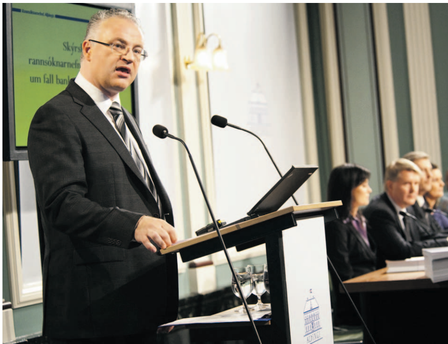
Høyesterettsdommer på Island, Pall Hreinsson.